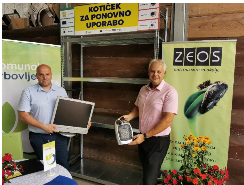
Slika: Simbolična oddaja aparatov v kotiček za ponovno uporabo EEO (levo direktor Komunale Trbovlje, desno direktor ZEOS).