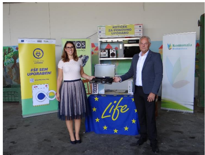
Slika: Simbolična oddaja aparata v kotiček za ponovno uporabo električne in elektronske opreme (levo direktorica Komunale Brežice, d.o.o., desno direktor ZEOS, d.o.o.).

Na ZC Boršt je postavljen nov kotiček za vse, ki bi želeli oddati svoje še delujoče aparate v ponovno uporabo. Kotiček je označen z rumeno tablo ter tako nezgrešljiv. Vanj se lahko odda še delujoče aparate za ponovno uporabo: velike aparate - pralne in pomivalne stroje, pečice, štedilnike, hladilnike, zamrzovalnike, orodje za dom in vrt, male gospodinjske aparate, avdio-video in foto opremo, monitorje in televizorje z ravnim zaslonom, računalnike, mobilne telefone, igrače in ostale primerne aparate na elektriko ali baterije.