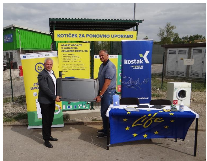
Slika: Simbolična oddaja aparata v kotiček za ponovno uporabo električne in elektronske opreme (levo direktor ZEOS, d.o.o., desno direktor sektorja komunale v družbi Kostak, d.d.).

Na ZC Spodnji Stari Grad je postavljen nov kotiček za vse, ki bi želeli oddati svoje še delujoče aparate v ponovno uporabo. Kotiček je označen z rumeno tablo ter tako nezgrešljiv. Vanj se lahko odda naslednje še delujoče aparate za ponovno uporabo: velike aparate - pralne in pomivalne stroje, pečice, štedilnike, hladilnike, zamrzovalnike, orodje za dom in vrt, male gospodinjske aparate, avdio-video in foto opremo, monitorje in televizorje z ravnim zaslonom, računalnike, mobilne telefone, igrače in ostale primerne aparate na elektriko ali baterije.