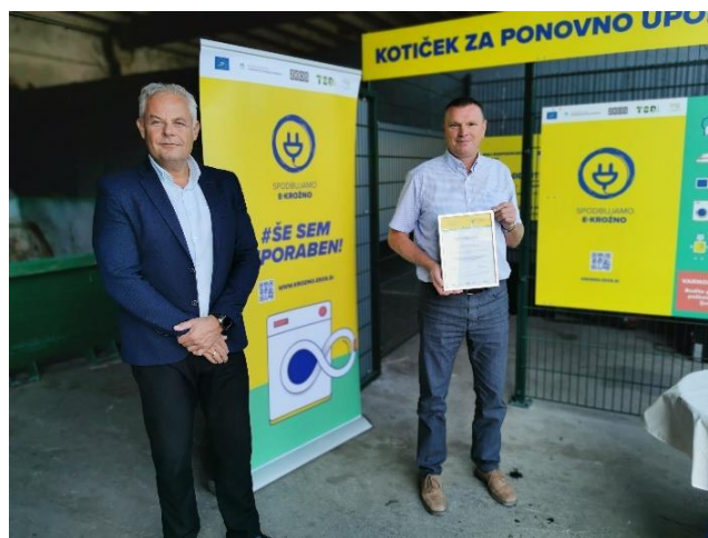
Slika: Podpisna listina ob predaji kotička ponovne uporabe za EEO (levo direktor ZEOS, d.o.o., desno direktor KSP Litija d.o.o.)

Vanj se lahko odda naslednje še delujoče aparate za ponovno uporabo: velike aparate - pralne in pomivalne stroje, pečice, štedilnike, hladilnike, zamrzovalnike, orodje za dom in vrt, male gospodinjske aparate, avdio-video in foto opremo, monitorje in televizorje z ravnim zaslonom, računalnike, mobilne telefone, igrače in ostale primerne aparate na elektriko ali baterije.